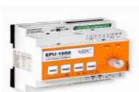
EPU-1500 Dimmer 230V