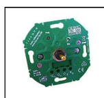
Manueller Universal Drehdimmer TKC-300