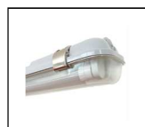
ITF-D120 kompakte Wannenleuchte zweiflammig