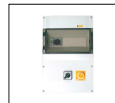
Individuelle Lichtsteuerungen nach Kundenwunsch

Strahlwinkel 123,6° (16 PLANES) 32 C-Planes