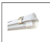
ITF-S120 kompakte Wannenleuchte einflammig